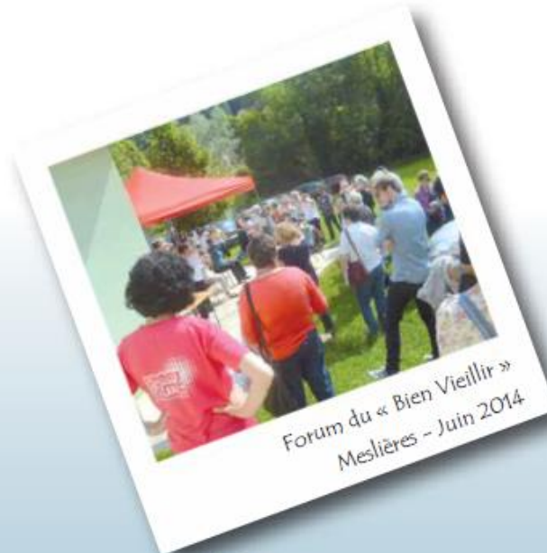
Forum du « Bien Vieillir » Meslières - Juin 2014

Communauté de communes « Les Balcons du Lomont » Rue Jules Ferry 25310 Blamont Tél. 03 81 35 18 12 - Fax : 03 81 35 18 19 Courriel : contact@cc-balcons-du-lomont.fr Directeur de publication : Claude Perrot Impression : CCBL - Dépôt légal : 1 er trimestre 2015