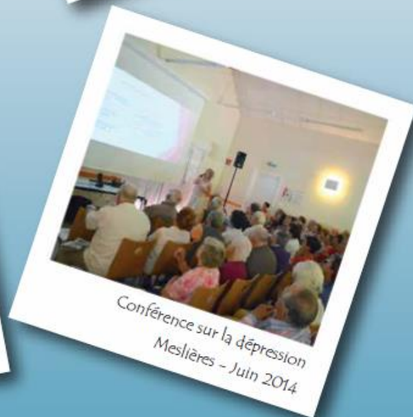
Conférence sur la dépression Meslières - Juin 2014

Vous pouvez retrouver ce bulletin ainsi que tous les comptes rendus de réunions sur le site : http://www.cc-balcons-du-lomont.fr