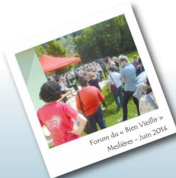
Forum du « Bien Vieillir » Meslières - Juin 2014

Communauté de communes « Les Balcons du Lomont » Rue Jules Ferry 25310 Blamont Tél. 03 81 35 18 12 - Fax : 03 81 35 18 19 Courriel : contact@cc-balcons-du-lomont.fr Directeur de publication : Claude Perrot Impression : CCBL - Dépôt légal : 1 er trimestre 2015